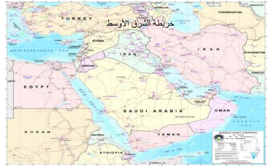
خريطة الشرق الأوسط