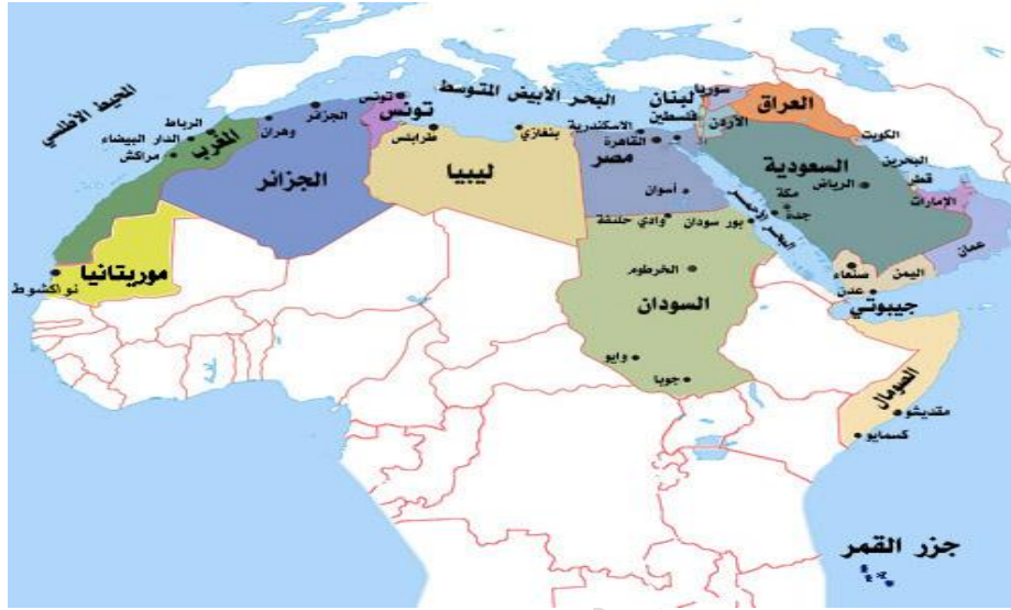
خريطة العالم العربي